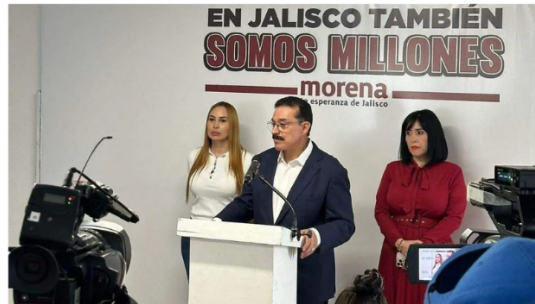
El legislador morenista recordó que desde el Congreso se dio el primer paso y se aprobó la reforma judicial.

El tribunal de disciplina judicial será el órgano responsable de vigilar, evaluar y sancionar a jueces y magistrados que no cumplan con su deber, explicó